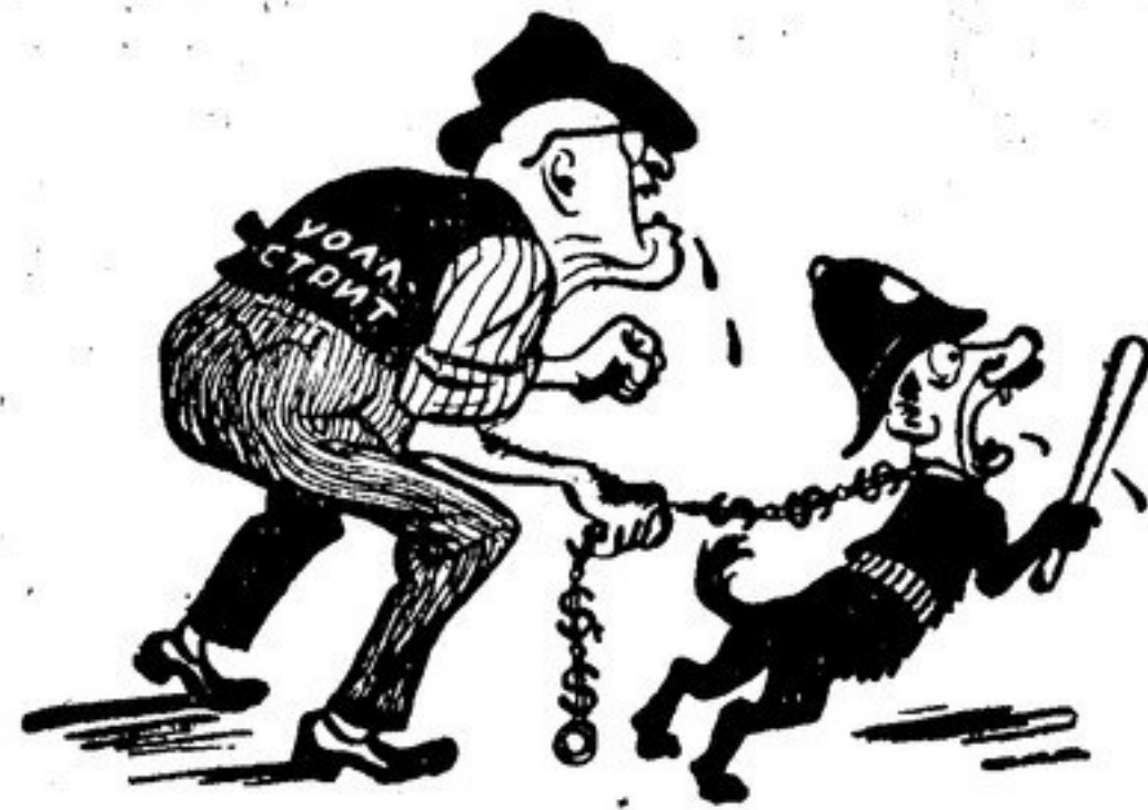
Рис. Бор. ЕФИМОВА

Своею правдой честной, Своею дружной тесной Отряды их сильны. Они в борьбе суровой Мир отстают готовы, А мир сильней войны.