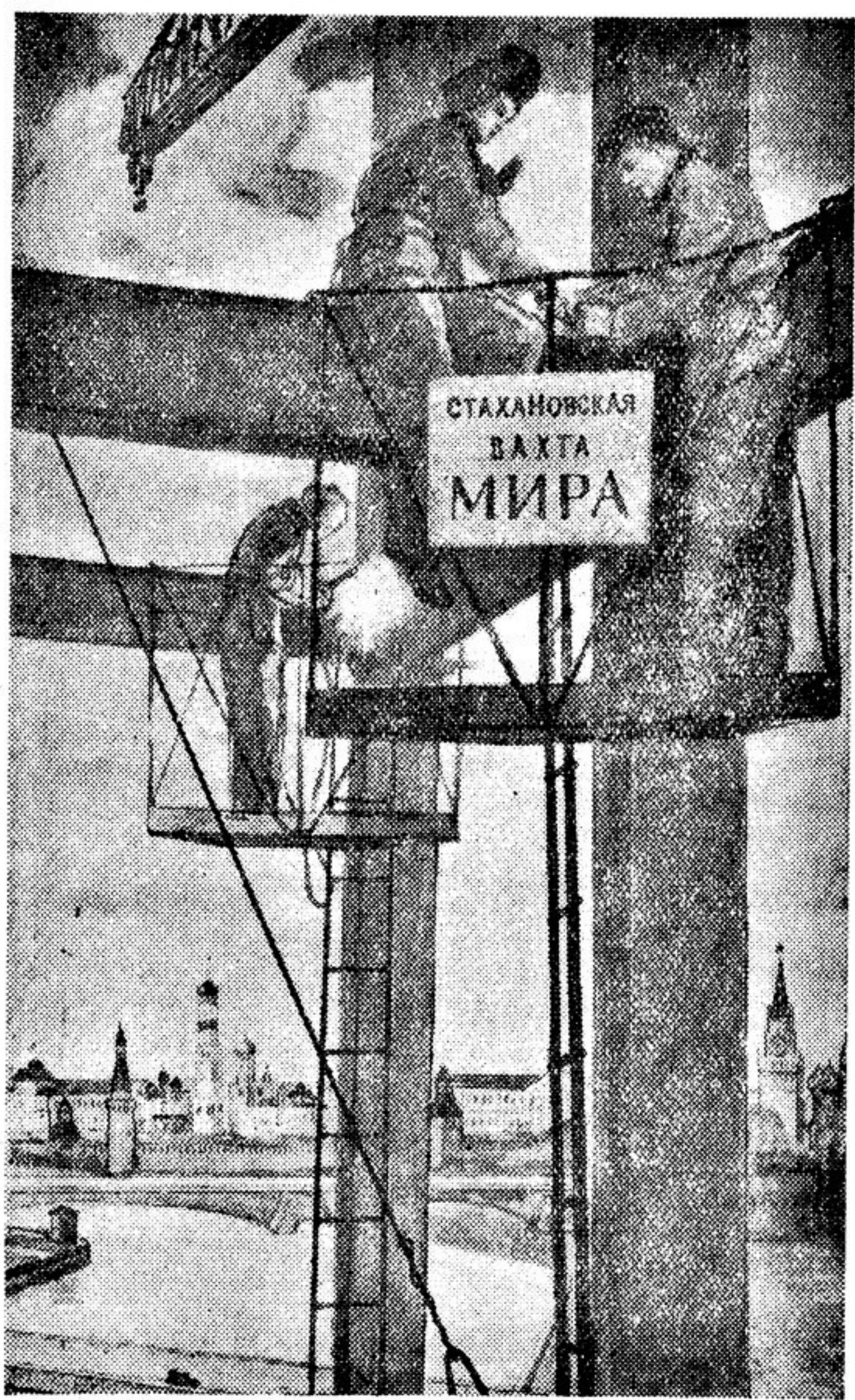
Рис. худ. М. КЛЯЧКО

В Варшаве открывается Второй Всемирный конгресс сторонников мира. Все прогрессивное человечество через своих делегатов участвует в этой великой ассамблее народов. Здесь, в Варшаве, протянут друг другу братские руки представители движения в защиту